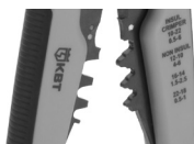
Модуль для опрессовки WS-04A

Направляющие модуля «CatPro» позволяют избежать смещения лезвий и их врезания друг в друга. Возвратные пружины (2шт.) служат для возврата прижимных губок и рукояток в исходное положение.