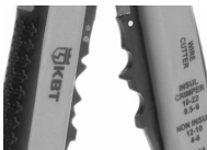
Модуль для опрессовки WS-07, WS-17

Предназначен для опрессовки втулочных наконечников типа НШВ, НШВИ сечением от 0,5 до 6,0 мм 2