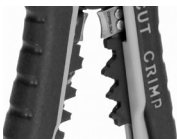
Модуль для опрессовки WS-11

Предназначен для опрессовки изолированных гильз и наконечников сечением от 0,5 до 6 мм 2 (НКИ, НИК, НВИ, ГСИ, НШКИ, НШПИ, изолированных разъемов), а так же неизолированных гильз и наконечников, в том числе и автоклемм